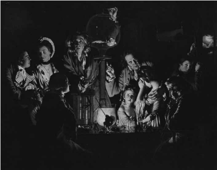
AN EXPERIMENT ON A BIRD IN THE AIR PUMP 1768.