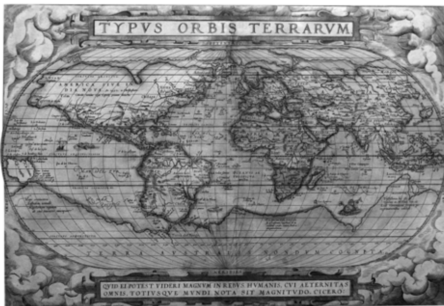
ORBIS TERRARUM 1575

http://members.fortunecity.es/cartografias/antart.html