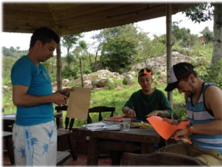
Campamento II, Fusa: marzo de 2014.

Trabajar actividades que interpelen el cuerpo de los participantes con el fin de construir conocimiento desde la experiencia más que desde el discurso. Se trata de darle un lugar al cuerpo, cómo se hace presente en los ejercicios de talleres y por qué lo abordamos. Pregunta: ¿cuándo me dicen que yo haga un ejercicio de cuerpo en mi taller, qué debo hacer? Mínimos a cumplir: 1) Hacer más