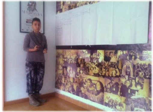
Elaboración de mentefactos en Radio Diversia, 2014.

Indicaciones: 1) llegar travestido e identificarse con el género que no leen las demás personas (por ejemplo, teniendo una identidad de género masculina llegar vestido de “mujer” y enunciarse como mujer), lo que entendemos simplemente como travestismo o 2) llegar sin travestirse e identificarse con el género que no leen las otras personas (por ejemplo, tener una identidad de género masculina y enunciarse como mujer sin cambiar en nada el comportamiento o la vestimenta), lo que denominamos travestismo