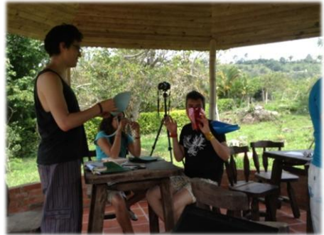
Campamento II, Fusa: marzo de 2014.

Dinamizar actividades que generen un leve grado de incomodidades en los participantes, para que, a través de esta incomodidad, salgan a la luz los prejuicios sobre el género y posibles discusiones constructivas alrededor de él. Se trata de realizar alguna actividad que suscite algún grado de incomodidad desde el prejuicio (elementos de identidad, actitudes, paradigmas). Mínimos a cumplir: 1) No buscar la incomodidad desde la confrontación sino desde las instrucciones del ejercicio. 2) Que la incomodidad evidencie el prejuicio dentro del Universo pedagógico .