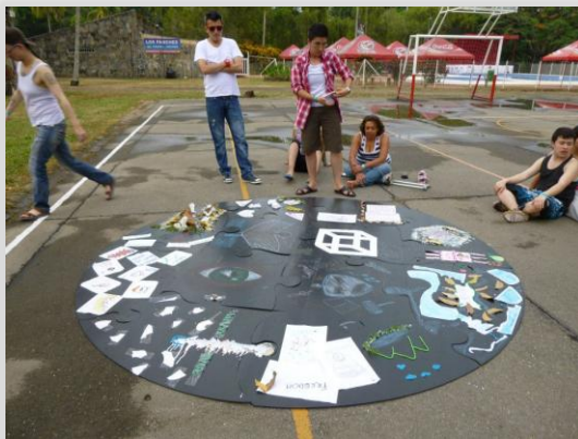
Campamento de sistematización I, Villeta: enero de 2013

Esta construcción de conocimiento colectiva comenzó en el marco del proyecto denominado: “Empoderamiento del Colectivo Entre Tránsitos y jóvenes transmasculinos: TransformArte es tu derecho” en alianza con el Colectivo de Hombres y Masculinidades y financiado por CIVIS-Suecia y Forum Syd-Alemania. Su primera fase fue implementada a través de diferentes talleres con grupos focales durante los meses de agosto y diciembre del año 2012 en la ciudad de Bogotá.