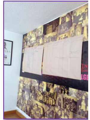
Elaboración de talleres en Radio Diverisa