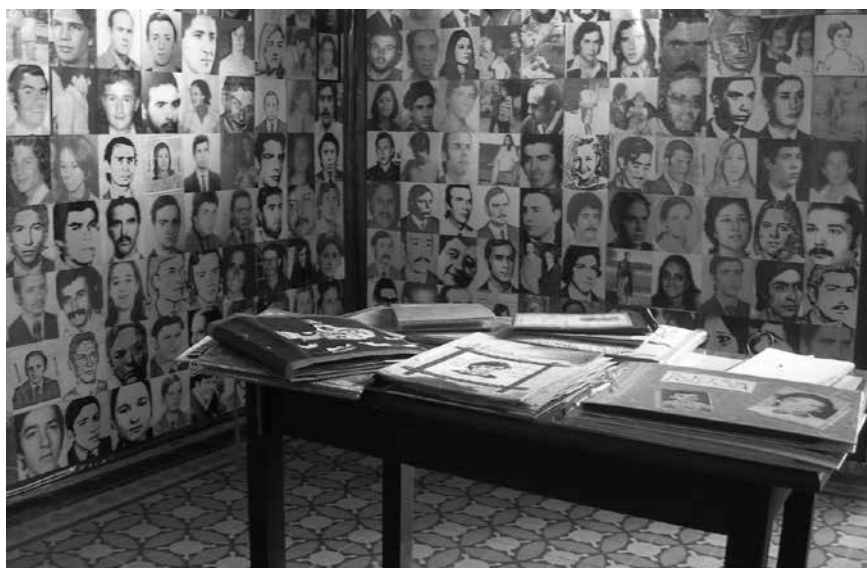
Sala Vidas para ser Contadas. Archivo Provincial de la Memoria-Córdoba

Diversas experiencias del uso público de las fotografías de los desaparecidos en instituciones de la memoria podrían ser analizadas aquí. 8 Sin embargo, voy a detenerme en un tipo de uso institucional en especial, la sala Vidas para ser contadas del Archivo Provincial de la Memoria (APM), de Córdoba. En este espacio se da un proceso particular del uso de la fotografía de desaparecidos.