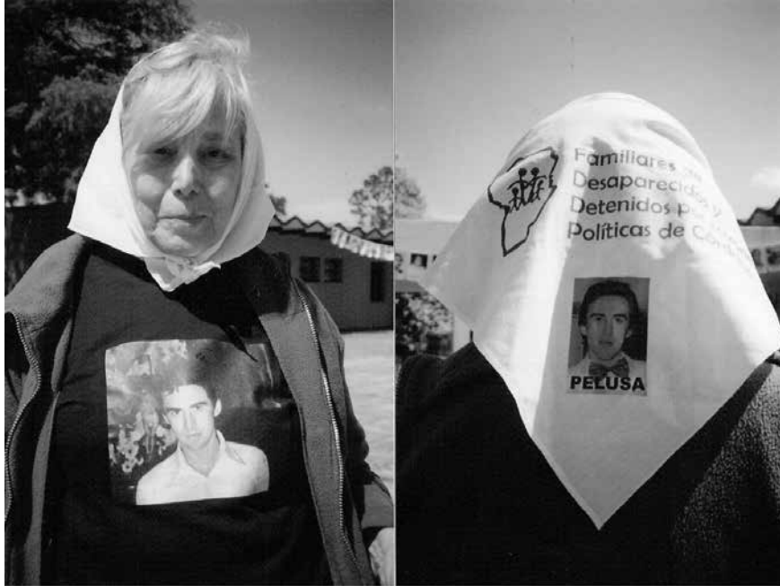
La Pepa evoca a su hijo en el Acto de Apertura del Sitio de Memoria La Perla (ex CCD)- Córdoba.