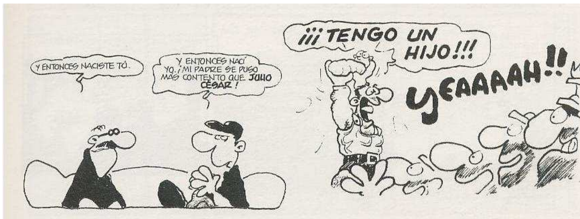
[Figura 4: flashback ficcional] (König, 2004 a, 7, detalle de viñeta)