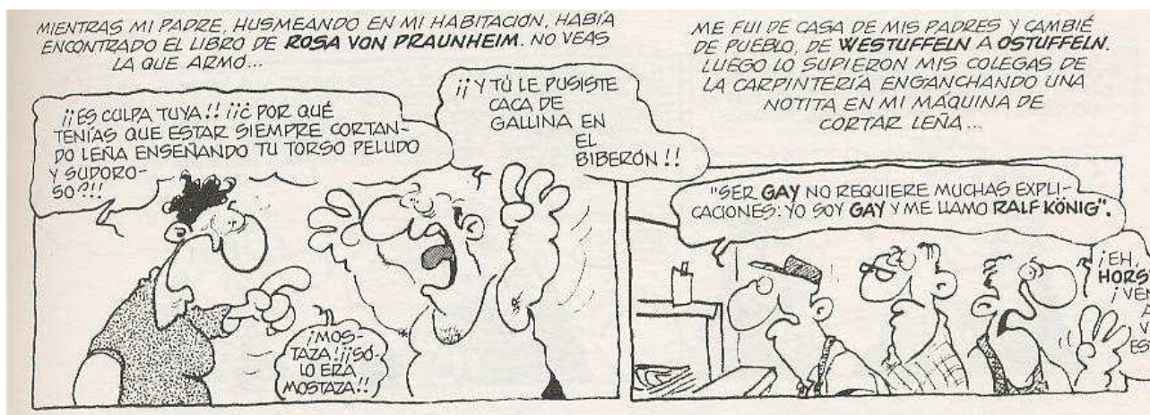
[Figura 7: discusión de los padres/humor] (König, 2004 a, 46, detalle de viñeta)