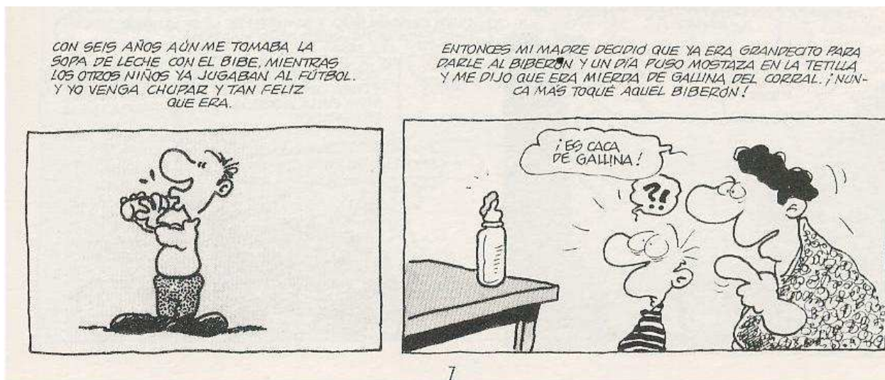
[Figura 6: deconstrucción de la infancia] (König, 2004 a, 7, detalle de viñeta)