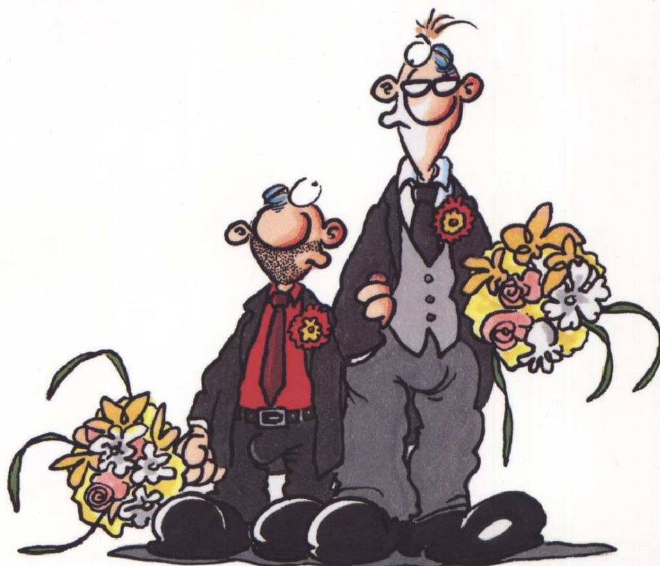
[Figura 1] (König: 2003, tapa)