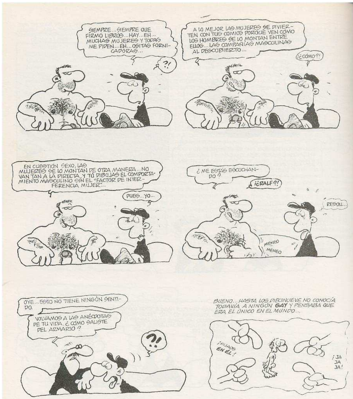
[Figura 8: recurso de corporización] (König, 2004 a, 44)